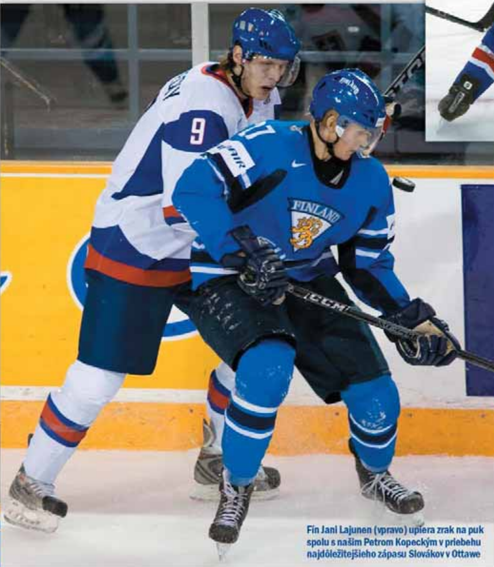
Fin Jani Lajunen (vpravo) upiera zrak na puk spolu s našim Petrom Kopeckým v priebehu najdôležitejšieho zápasu Slovákov v Ottawe

Perfektná defenzíva a smrtiace kontry prinášali Američanov do zúfalstva. Úvodných desať minút sa vyvíjalo podľa osvedčeného scenára - do útočného pásma sme sa dostávali len sporadicky a po „naverímboha“ vyhadzovaných pukoch. Brankár Janus kryl aj trestné strieľanie, hneď v prvej minúte. Prvý raz udrel Bezák, ktorý omráčil "zamrznutého" McColluma. Hoci Američania vyrovnali, naši „z čista jasna“ pridali dva góly - najprv Pánik posunul puk Tatárovi a ten bekendom zavesil, potom sa rozbehli Bezák s Kytárnarom a Molnár opäť od praveho mantinelu príklepom prestrelil nespoľahlivého brankára. Na rozdiel od amerického slovenský gólmán čaroval a hoci Američania búšili cez prehustenú modrú čiaru, ich hra postupne strácala na údernosti. V závere ešte Tatár prikrášľoval do prázdnej bránky na 5:2 a boli sme v semifinále!