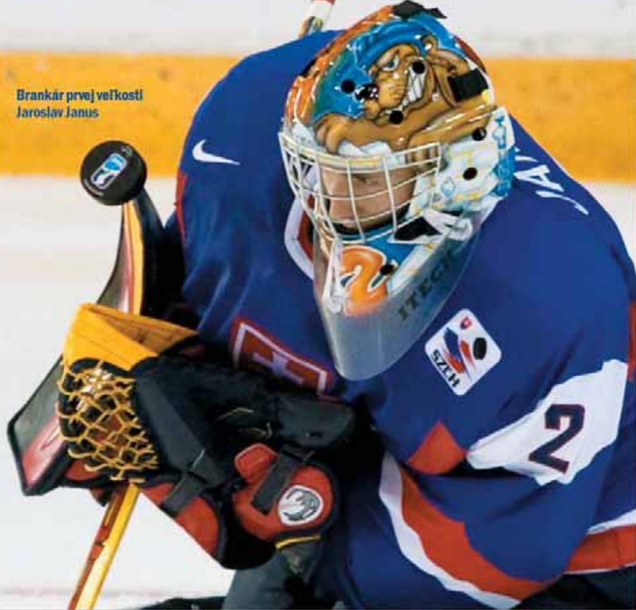
Brankár prvej veľkosti Jaroslav Janus